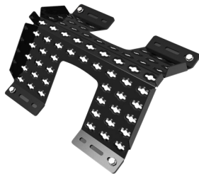
Taksteg för plåttak 3210