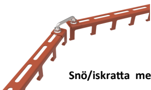
Snö/iskratta med svängd montering