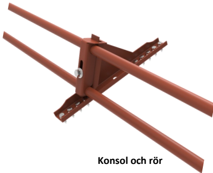
Konsol och rör