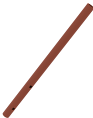
Stolpe 50 cm